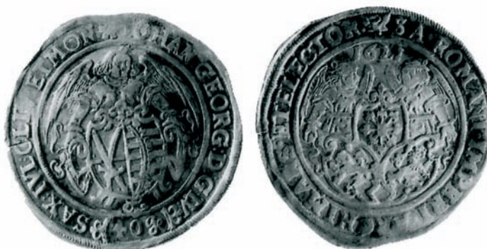
Bild 6: Kippertaler zu 40 Groschen aus dem Fund von 2002 (Av u. Rv)

Widmen wir uns nun der Analyse einer Kippermünze aus dem großen Fund von 2002.