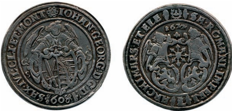
Bild 5: Kippertaler zu 60 Groschen in Herzbergs Turmknauf (Av u. Rv)

Sehen wir uns zunächst einen der Kippertaler aus dem Turmknauf und anschließend das jüngst gefundene Stück genauer an und versuchen diese einzuordnen.