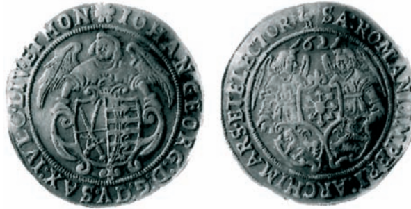
Bild 7: Kippermünze der Münzstätte Merseburg (Nr. 515 aus dem Fund von 2002) (Av u. Rv)

“Der Stil der merseburgischen Kippermünzen ist zumeist ein besonderer. Es ist daher wohl anzunehmen, daß die Stempel in Merseburg selbst angefertigt wurden, vielleicht jedoch nicht alle, wie einige einfache Engeltaler mit dem typisch Leipziger und Dresdner Stil zeigen. Noch auffälliger ist, daß bei einigen merseburgischen Engeltalern ein unverkennbar merseburgischer Vorderseite-Stempel mit einem unverkennbar Leipziger oder Dresdner Rückseite-Stempel kombiniert ist. Eine Erklärung dafür fehlt bisher noch.”